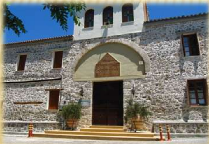
ΙΕΡΑ ΜΟΝΗ ΛΕΥΚΩΝ - ΑΓΙΟΥ ΧΑΡΑΛΑΜΠΟΥΣ ΑΥΛΩΝΑΡΙΟΥ