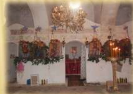
ΜΟΝΗ ΟΣΙΟΥ ΝΙΚΟΛΑΟΥ ΣΙΚΕΛΙΩΤΟΥ