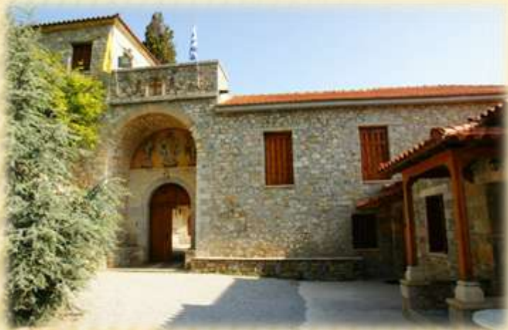
ΙΕΡΑ ΜΟΝΗ ΜΕΤΑΜΟΡΦΩΣΕΩΣ ΣΩΤΗΡΟΣ ΚΥΜΗΣ