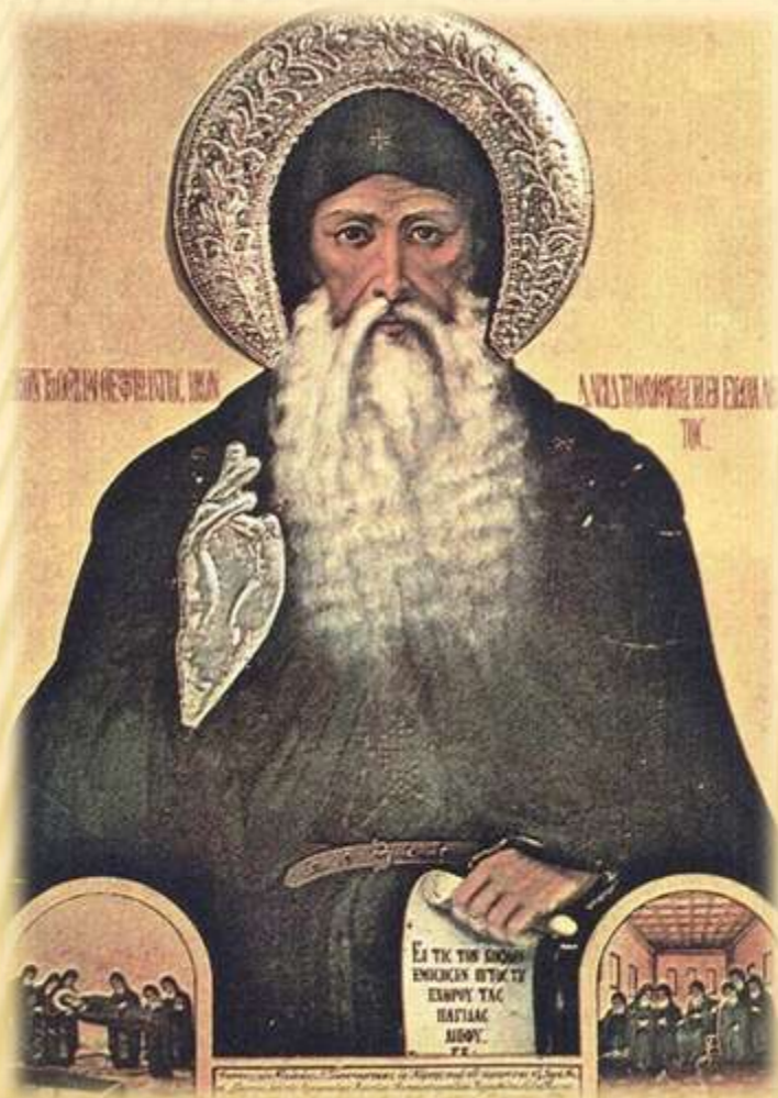
ΟΣΙΟΣ ΔΑΥΪΔ Ο ΓΕΡΩΝ