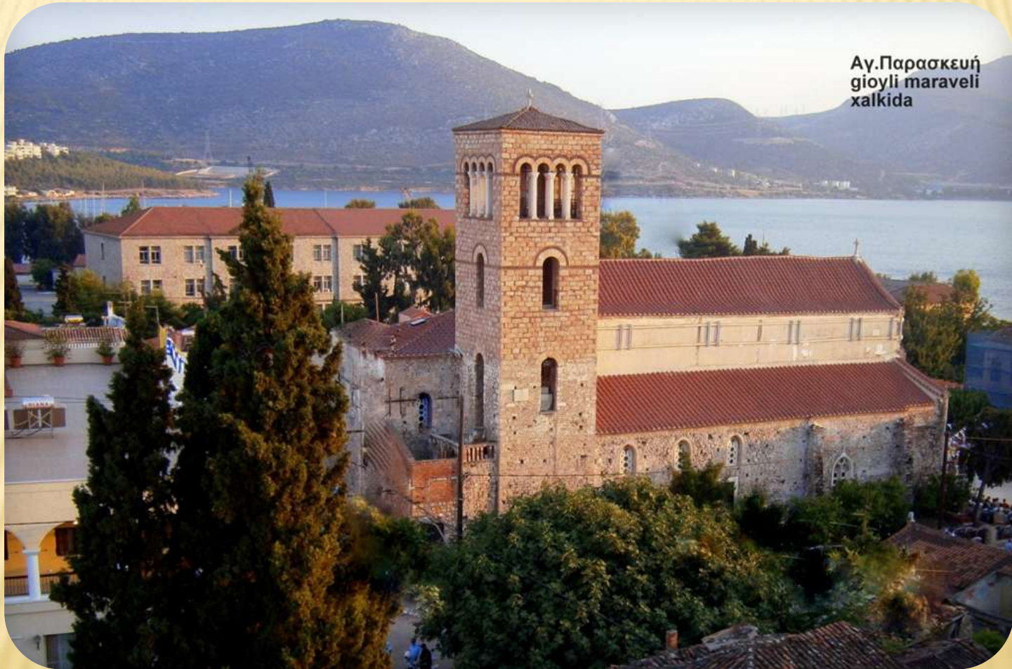
Αγ.Παρασκευή gioyli maraveli chalkida