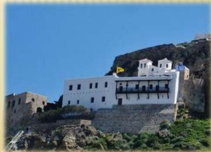
ΙΕΡΑ ΜΟΝΗ ΑΓΙΟΥ ΓΕΩΡΓΙΟΥ ΣΚΥΡΟΥ