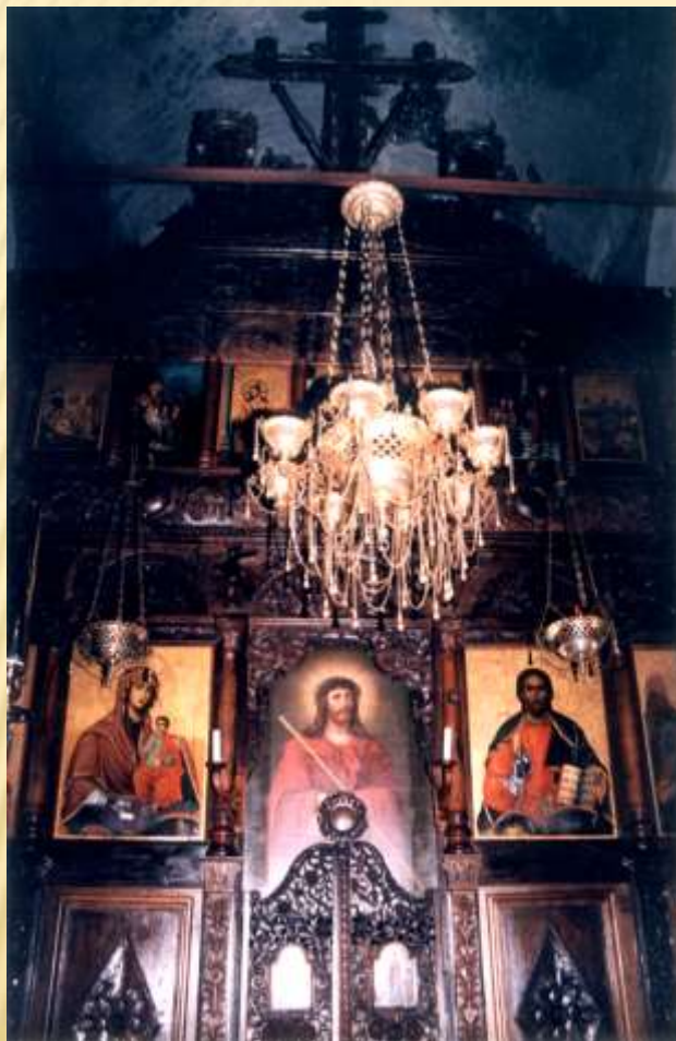
ΤΕΜΠΛΟ ΤΗΣ Ι. ΜΟΝΗΣ