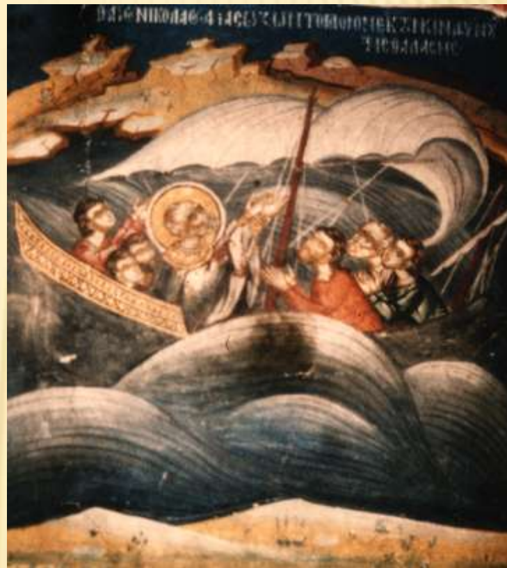
ΤΜΗΜΑ ΤΗΣ ΤΟΙΧΟΓΡΑΦΙΑΣ